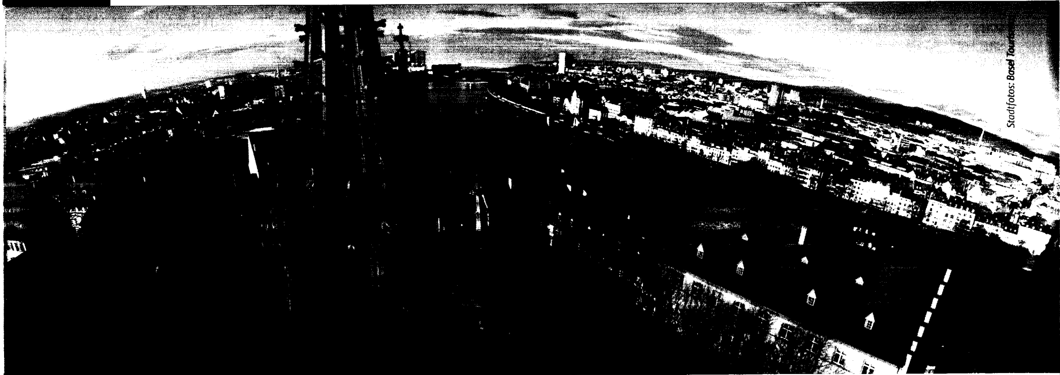
Stadtfotos: Basel Tour