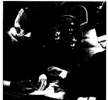
Ambulante Hernienoperationen bergen kein höheres Risiko als stationäre Eingriffe.