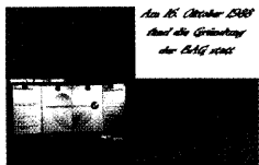
Am 15. Oktober 1988 Amal die Gründung der BAG statt