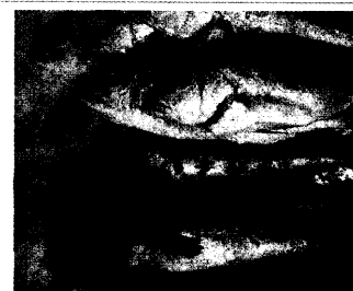
Gesundes Lebensmittel trotz Quecksilber?