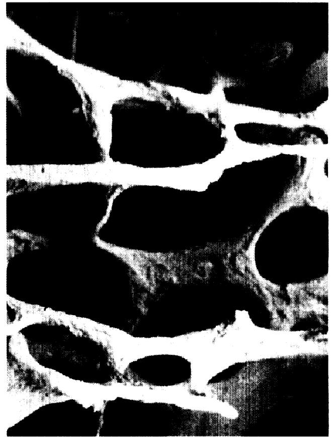
Struktur eines osteoporotischen Knochens

Editorial: Trotz Agonie – Niedergang der Phytotherapie aufhalten!