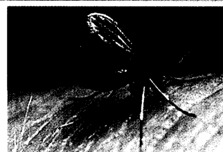
Phlebotomus sp.