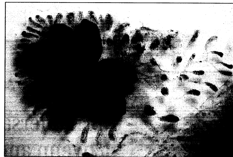
Die Seescheide Botryllus schlosseri hat Zellen mit Rezeptoren, die denen auf menschlichen Killerzellen ähneln.