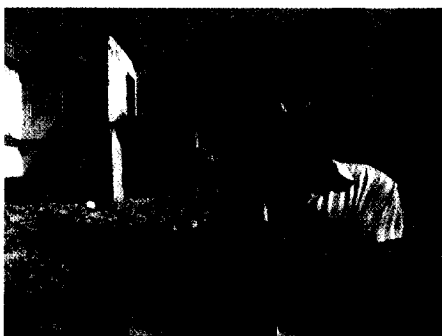
Seite 34 Blindgänger und Fundmunition gefährden das Leben im Nachkriegsirak