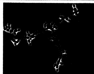
Phasenkontrastmikroskopie des Urins. Was sehen Sie?