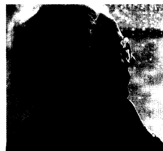
Bei einer Depression ist oft auch der Hausarzt gefragt