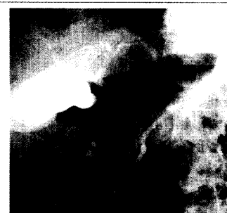
Normales retrogrades Cholangiopankreatikogramm