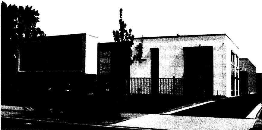
Das neue Firmengebäude der Andreas Fahl Medizintechnik.