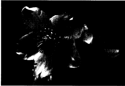
Titelfoto: Christrose (Helleborus niger)