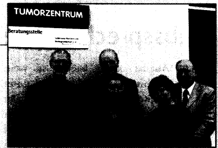
Tumorzentrum in Kiel eröffnet