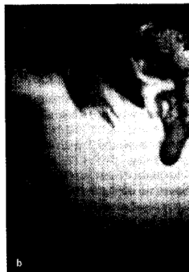
Dermatitis herpetiformis Duhring bei einem 8-jährigen Knaben. Glutenfreie Diät führte zur Remission ► Seite 706