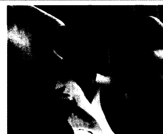
Inhalative Kortikoide bei Asthma lassen sich stufenweise reduzieren.