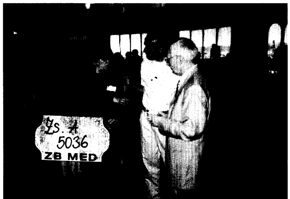
Vertreter des DNGfK im Gespräch mit dem Schweizer Netzwerkkoordinator

So wurden 33 Vorträge im gesamten Plenum gehalten und weitere 68 Vorträge regten die Besucher an, den Erfahrungsaustausch in den Workshops fortzusetzen. Darüber hinaus gab es eine Postersession mit 251 Poster, von denen die besten mit Preisen ausgezeichnet wurden. 478 registrierte Teilnehmer besuchten den Kongress. Zusammen mit den Referenten nahmen insgesamt 621 Personen an der Konferenz teil.