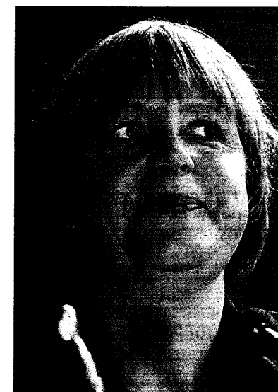
Telefonat mit dem Kanzler: CDU-

DT. ZENTRALBIBLIOTHEK TEAM 5. 1/23 JOSEPH-STELZMANN-STR. 9 50931 KOELN