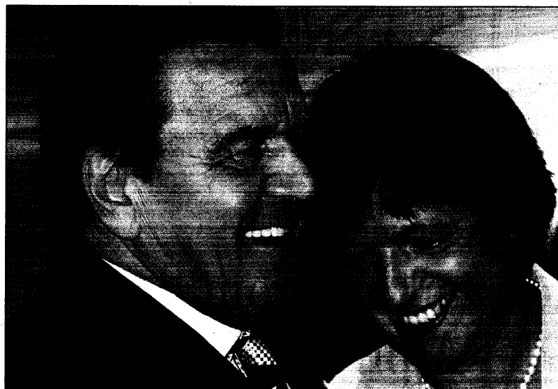
Lob vom Chef: Bundeskanzler Gerhard Schröder gratuliert Gesundheitsmini-