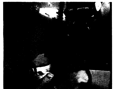
Auf therapeutischer Schatzsuche: Wissenschaftler durchforsten die reiche marine Flora und Fauna nach potenziellen Wirkstoffen – und werden immer häufiger fündig. Mehr auf Seite 16

Ernährung und Krebs Praxisorientierte Empfehlungen zur Prävention und Therapie