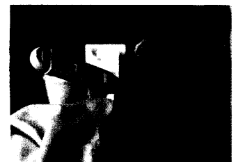
Eine Grippeimpfung schützt Asthmatiker im Erwerbsalter nicht vor Komplikationen.