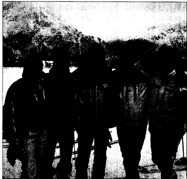
15. Wintersymposion der DGZI in Sölden war erneut ein großer Erfolg