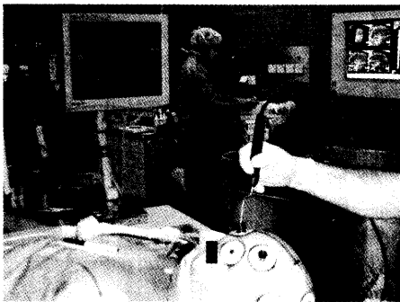
Registrierung der „Fiducials“ und Überprüfung der Präzision. ▶ Seite 22