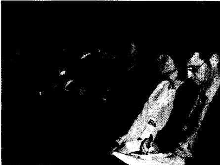
Ministerpräsident Kurt Beck hat an alle Ärztinnen und Ärzte im Land appelliert, „auch in schwierigen Zeiten miteinander im Dialog zu bleiben“. ▶ Seite 8