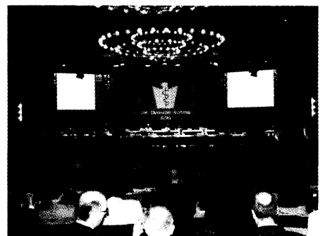
Der 106. Deutsche Ärztetag in Köln stand in diesem Jahr ganz im Zeichen der Weiter- bildungsreform und der aktuellen Diskussionen um die Gesundheitsreform. ▶ Seite 14

Offizielles Organ der Landesärztekammer, der Bezirksärztekammern und der Kassen- ärztlichen Vereinigungen Rheinland-Pfalz