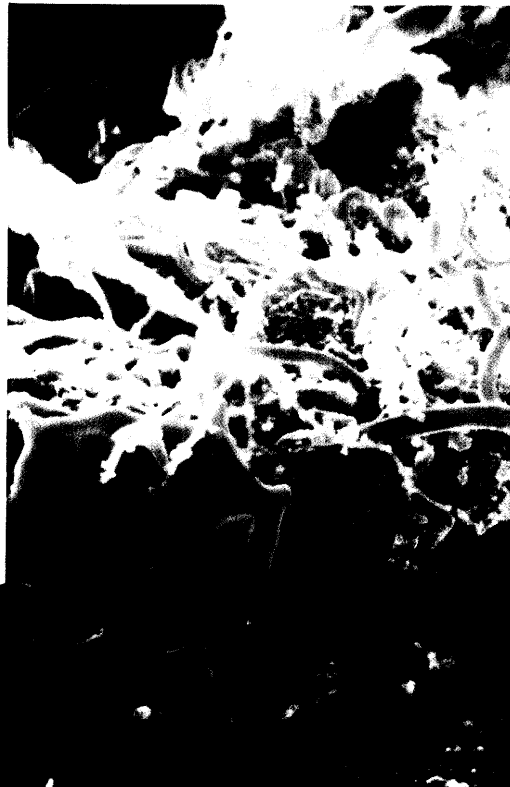
Welche Bakterien den Zahnbelag besiedeln, kann für die Therapie entscheidend sein. Ein neuer DNA-Test soll Klarheit bringen. Seite 32