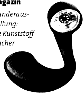
Zum Jahr der Chemie zeigt eine Ausstellung den Kunststoff von seiner bunten Seite. Sie startet am 27. Juni in Düsseldorf. Seite 56