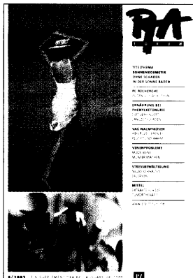
In dieser Ausgabe finden Sie das PTA-Forum 6.

Prüfzertifikate Ethanol 96% 113 / Neueinführungen 115 / Änderungen 129 / Dokumentation 131 / APG-Rückrufe 133 / Lagerwertausgleich 163 /