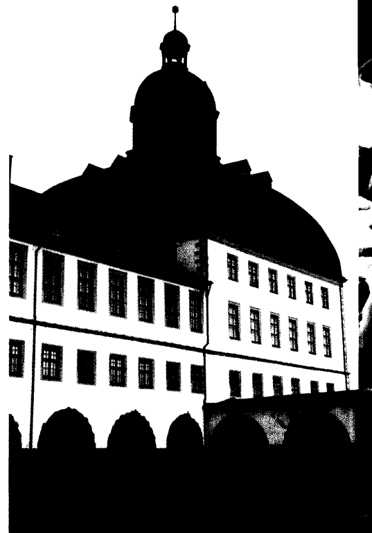
Spitzenforschung vor barocker Kulisse: Der fünfte Highlight-Kongress in der Residenzstadt Gotha bot faszinierende Einblicke in die Welt der modernen Naturwissenschaften und der Ethik. Seite 18

...senderi Apotheker Dr. Richard ... Deutschland 1933