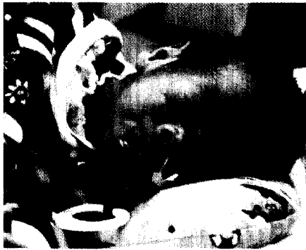
ZU UNSEREM TITELBILD:

Meist vergehen viele Stunden bis Tage bis eine Mutter ihr zu früh geborenes Baby sehen und in Kontakt treten kann.