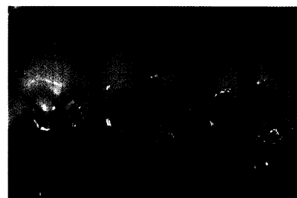
Bericht Seite 22