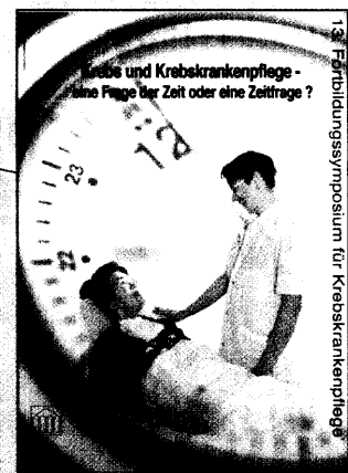
Symposium der KOK