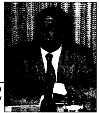
MdB Detlef Parr

„Freiberuflichkeit“ und „Gewerbesteuerpflicht“ sind zentrale Themen im Interview mit dem Präsidenten des Bundesverbandes der Freien Berufe Dr. Ulrich Oesingmann und im Statement von MdB Detlef Parr, der jede weitere politische Einengung der Ärzte und Zahnärzte grundsätzlich ablehnt.