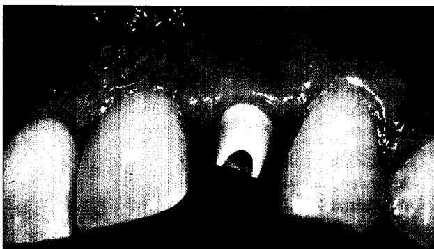
Die implantologische Frontzahnrestauration mit vollkeramischen Komponenten Seite 26

26 Die implantologische Frontzahnrestauration mit vollkeramischen Komponenten Dr. med. dent. Robert Koss