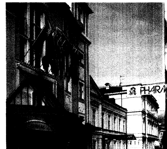
Erkrankungen der Haut und des Herz-Kreislauf-Systems standen im Mittelpunkt der 41. Fortbildungswoche der Bundesapothekerkammer in Meran. Einen ausführlichen Bericht vom vielseitigen Kongress lesen Sie ab Seite 26.