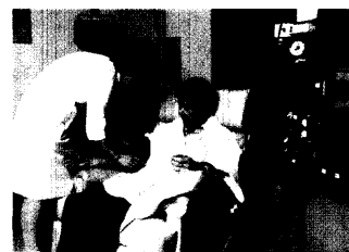
Bei Dialysepatienten steigt der Blutdruck in den Dialysepausen