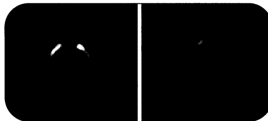
Das Parkinson-Syndrom beruht auf einer Degeneration von Nervengewebe im Bereich der Substantia nigra. Mit Hilfe einer neuen Diagnostik können Defekte jetzt frühzeitig erkannt werden.