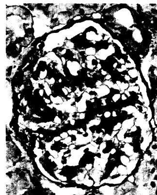
Histologisches Erscheinungsbild der IgA-Nephritis in der Lichtmikroskopie