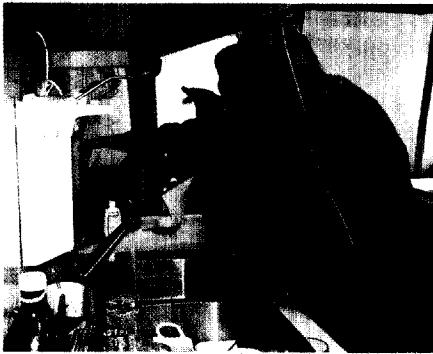
ZU UNSEREM TITELBILD:

Abbauerscheinungen im Alter lassen sich teilweise durch Training körperlicher, geistiger und sozialer Fertigkeiten verhindern oder zumindest verlangsamen.