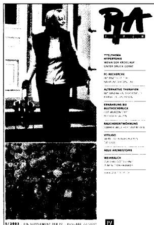
Dieser Ausgabe liegt das PTA-Forum 5 bei.

15 Leitlinien zur Optimierung der Arbeitsabläufe Mehrbesitz: SPD will die Kette Krankenhausgesellschaft für Öffnung der Klinikapotheken