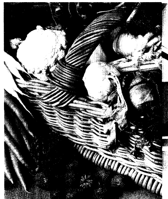
Zahlreiche Arbeitskreise haben gezeigt, dass Mikro-nährstoffe wie Vitamine, Mineralstoffe und Spurenelemente für eine gesunde Hautfunktionen von essenzieller Bedeutung sind und zudem ausgeprägte Schutzfunktionen ausüben können. Sinnvolle Nahrungsergänzungsmittel spielen hier eine bedeutende Rolle. Seite 26