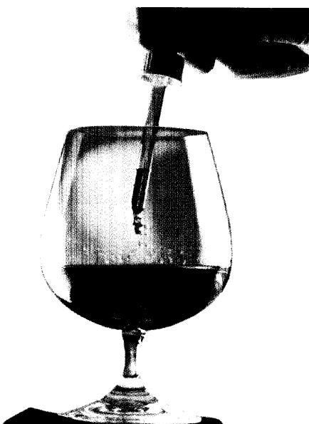
Agatha Christie zog das lautlose Gift den brutaleren Mordinstrumenten vor. Ihre Beschreibungen von Arsen, Strychnin, Blausäure und Co. sind so exakt, dass Toxikologen ihre Werke als Lehrbücher loben. Eine Ausstellung des Leipziger Apothekenmuseums beleuchtet die pharmazeutische Seite der Krimiautorin. Seite 70

Änderungen 121 / Dokumentation 123 / APG-Rückruf 125 /