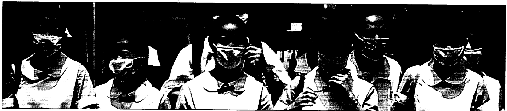
Mit Mundschutzmasken versuchen sich Krankenschwestern vom Krankenhaus San Lazaro in Manila vor SARS zu schützen.