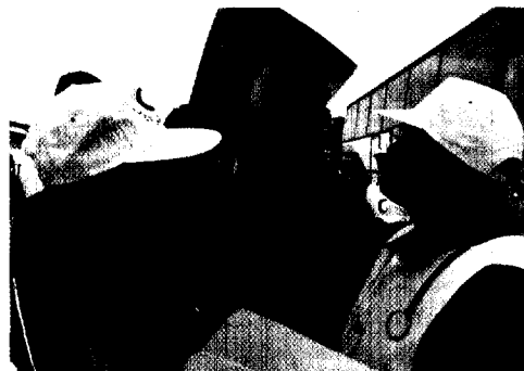
Seite 8 Jordanische Rothalbmond-Mitarbeiter versorgen Flüchtlinge aus dem Irak