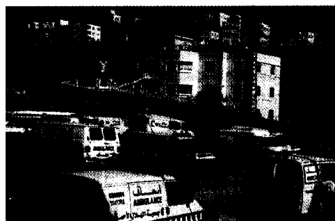
Seite 40 Der Rettungsdienst in Palästina unterliegt zahlreichen Repressalien