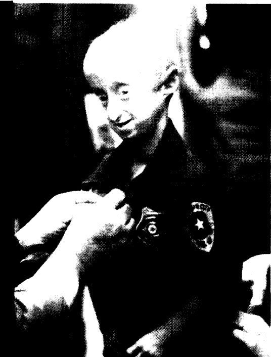
Wissenschaftler haben die Ursache der seltenen infantilen Progerie entdeckt. Der Austausch einer einzigen Base im Erbgut lässt die betroffenen Kinder rasend schnell altern. Seite 30