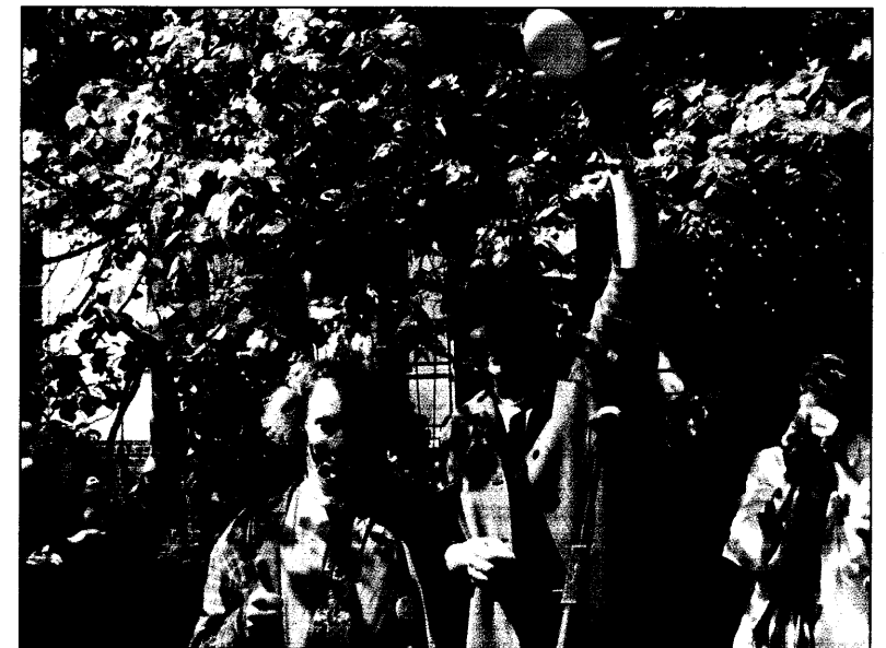
Eine Demonstration für die Ministerin

nusneuralgie sind jedoch begleitende autonome Symptome wie Tränenfluß, verstopfte Nase, Rhinorrhoe und Lidödeme. Autonome Symptome sind sonst eher typisch für Cluster-Kopfschmerzen. Bei Clusterkopfschmerzen dauern die Attacken jedoch mit 15 bis 180 Minuten wesentlich länger als bei dem neuen Syndrom, das als SUNCT (short lasting, unilateral