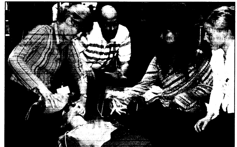
Erste Hilfe im Wiesbadener Messetrubel: Studentinnen beim Reanimations training am Stand des Unternehmens Sankyo Pharma.

rin bleibt auch dabei, das Krankengeld allein durch die Arbeitnehmer absichern zu lassen. Es soll aber weiterhin Leistung der gesetzlichen Krankenversicherung bleiben. Der Kanzler hatte in seiner Rede Mitte März eigentlich die Privatisierung dieser Leistung gefordert. Die einseitige Finanzierung des Krankengeldes allein durch Arbeitnehmer ist einer der