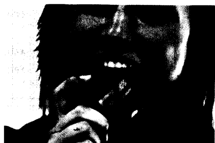
proDente mit Biss