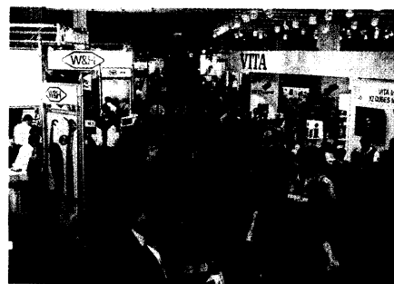
Besucherrekord auf der IDS