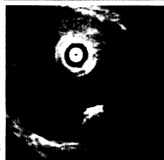
Kuppenreflex mit dorsaler Schallauslösung