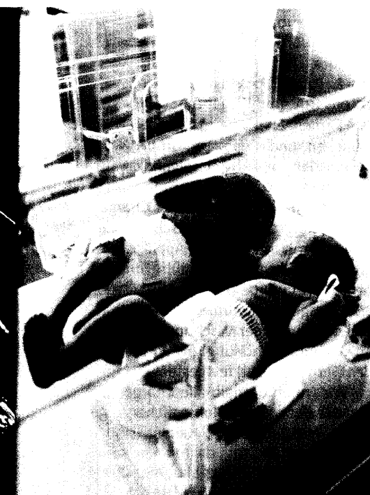
Risikante Mehrlingsgeburten und Schwangerschaften auf Probe sind nach Ansicht der Fachgesellschaften Folgen der gesetzlichen Regelungen zur Reproduktionsmedizin in Deutschland. Seite 34