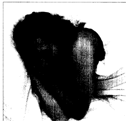
Pilotstudie: Nickelarme Diät vermindert chronische Erschöpfungszustände.