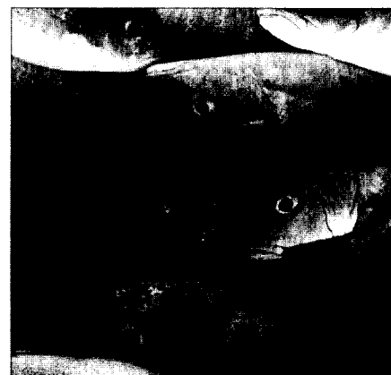
UNEP-Quecksilberbericht vernachlässigt Gesundheitsgefahr durch Zahnamalgame.