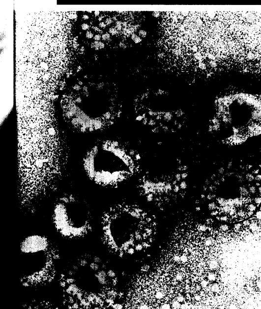
Ein bislang unbekanntes Coronavirus ist vermutlich der Erreger des Schweren Akuten Respiratorischen Syndroms (SARS), dem mittlerweile über 60 Menschen weltweit zum Opfer gefallen sind. Seite 37

Gesundheit ist eines der großen gesellschaftlichen Themen, an dem auch die Medien nicht vorbei kommen. Ein beachtlicher Markt, wenn man dazu noch Kundenzeitschriften und Fachmedien zählt. Wird die geplante Strukturreform den Versicherten mehr als bisher in die Eigenverantwortung nehmen, so prognostizieren Experten einen weiteren Boom der Berichterstattung in Hörfunk, Printmedien und Fernsehen. Mehr dazu ab Seite 46