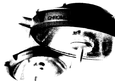
Auf unseren Produktseiten finden Sie wieder eine aktuelle Übersicht über Neues und Interessantes.