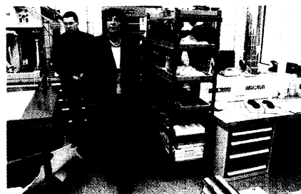
Gesundheitsministerin Ulla Schmidt sieht im Haus am Hasselbachplatz ihre Vorstellungen von integrierter Gesundheitsversorgung verwirklicht.

Schmidt lobt das Gesundheitszentrum Hasselbachplatz 12