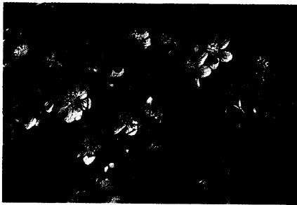
Titelfoto: Leberblümchen von Margot Spohn