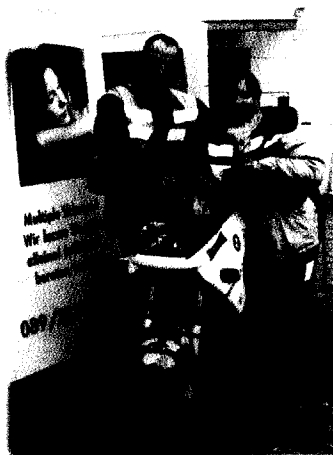
Australier machten in München Station