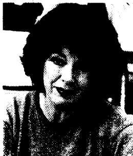
Dr. Marianne Koch, Internistin, Medizinjournalistin und Schauspielerin

Als Praktiker ist es mir wichtig, dass die Stellungnahmen zu neuen wissenschaftlichen Entwicklungen zunehmend aktueller werden und somit klare Entscheidungshilfen für die Praxis liefern.